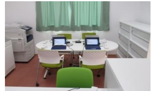
ミーティングスペース