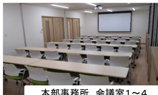
本部事務所 会議室1~4