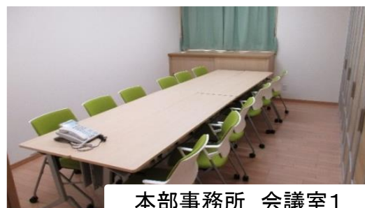
本部事務所 会議室1