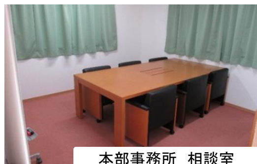
本部事務所 相談室