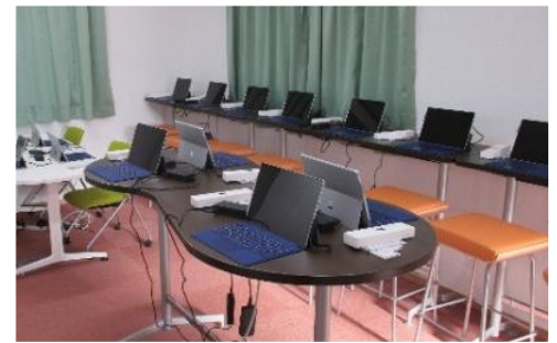
記録管理システムの一部