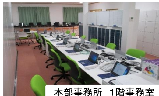
本部事務所 1階事務室